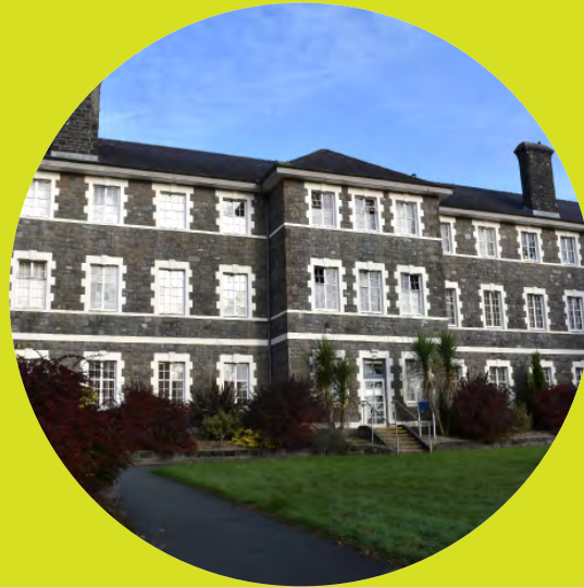
Parc Dewi Sant